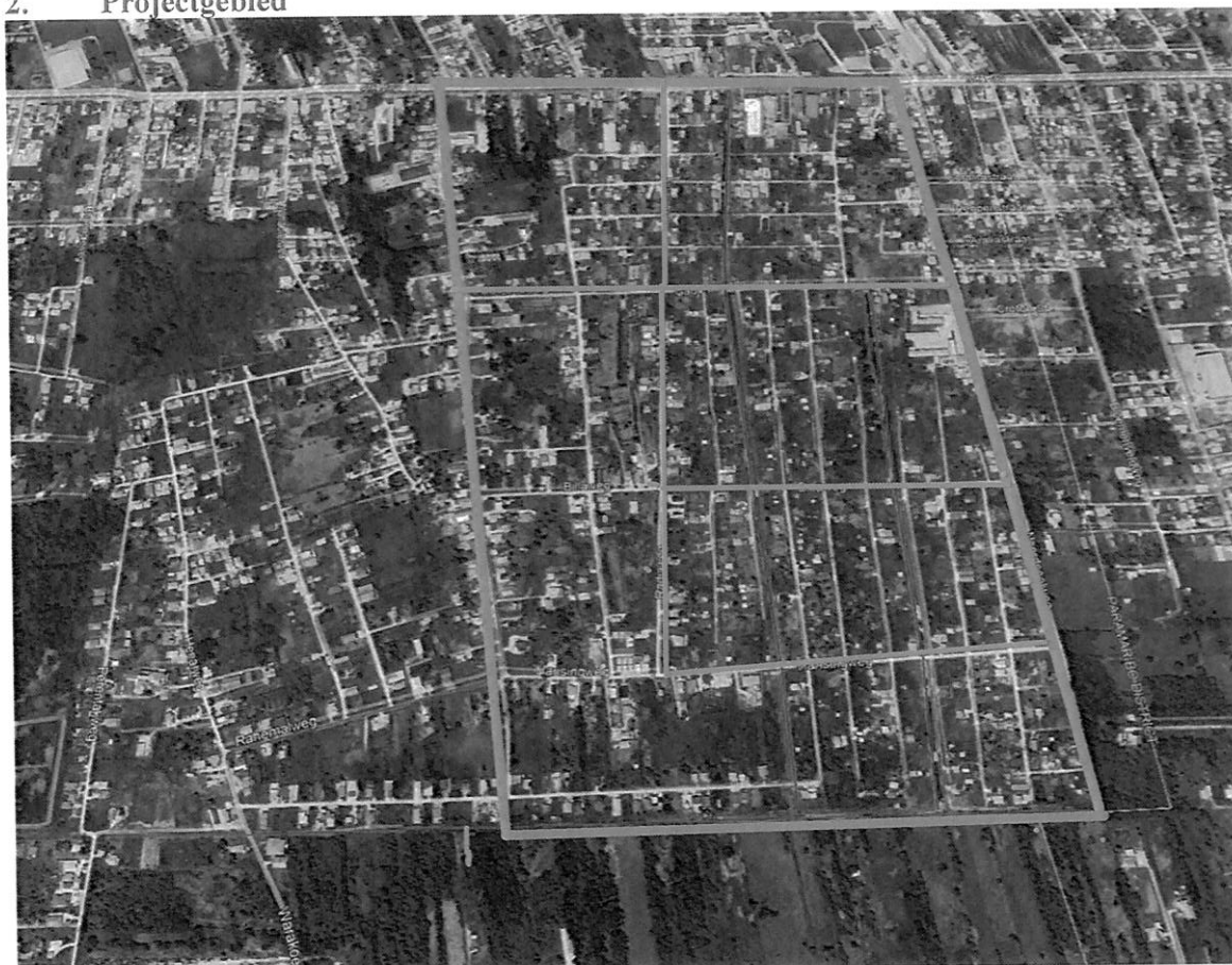
Figuur 1. Projectie locatie: Grensgebied