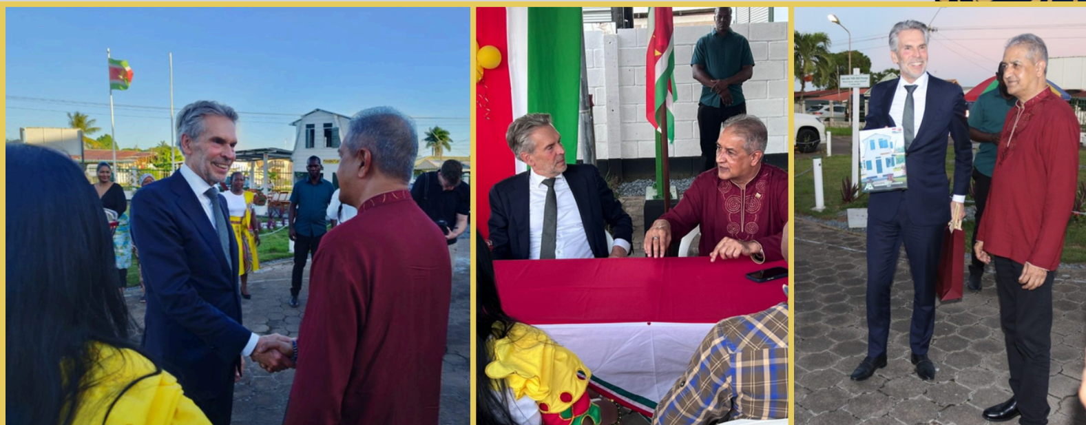
Impressie van het bezoek van de Minister-President van Nedeland aan SAO.

Het bezoek stond vooral in het teken van een kennismaking met Oso Tori Oso, het houten miniatuurhuis dat werd gebouwd naar het voorbeeld van een traditionele Surinaamse volkswoning aan de Mahonylaan. De realisatie vond plaats door cursisten van de afdelingen Bouw, Machinale Houtbewerking, GaWaSa en Lassen van de SAO. Oso Tori Oso is een doorlopend project van de Nederlandse stichting Under the Blue Surface (UBS) in samenwerking met onder andere SAO en NAKS. Het project bevindt zich op het grensvlak van erfgoed, kunst, theater en architectuur en belicht de unieke Surinaamse bouwwijze en de bijzondere verhalen van de kleine houten volkswoningen die langzaam uit het straatbeeld van Paramaribo verdwijnen. Met een brede groep betrokkenen in Suriname en Nederland wordt het verhaal van deze huizen onderzocht en verbeeld. Het leertraject van de SAO maakte integraal deel uit van dit initiatief.