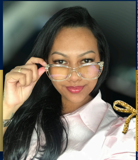
Geschreven door: Lucretia Setrodipo

De schrijver van deze rubriek is Lucretia Setrodipo, communicatiewerker op het ministerie met een speciaal nieuwsgierig oog voor kwaliteiten van collega's op het ministerie.