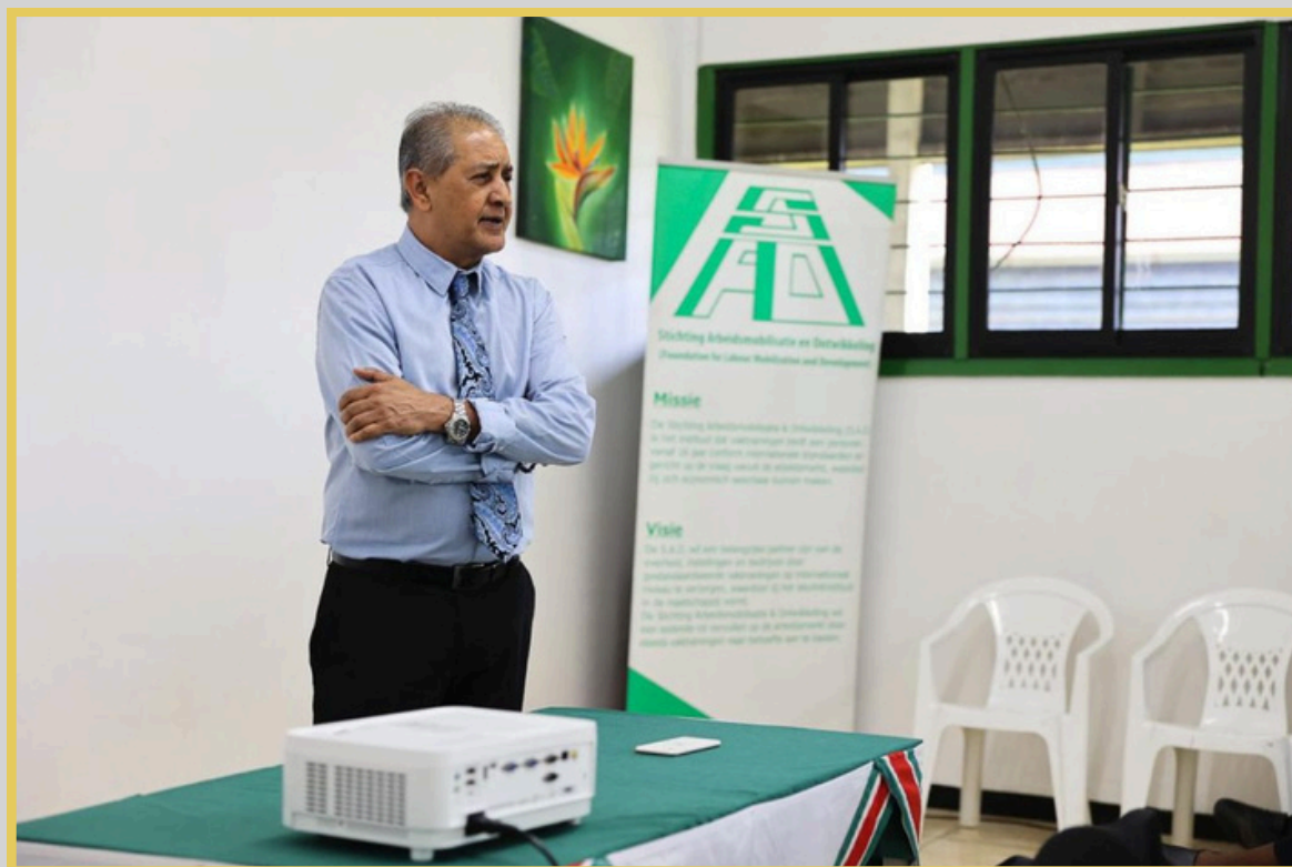
Onderminister VWA, Jadnanansing, sprak de cursisten toe.

De onderminister ging verder in op het risico van het onderdrukken van emoties. Hij waarschuwde dat het vermijden of verdoven van gevoelens door middel van middelengebruik, zoals drugs, alcohol of gokken, geen oplossing biedt voor persoonlijke problemen. Het lichaam reageert volgens hem op innerlijke zwaktes, en het negeren van emoties kan leiden tot ongezonde situaties. Hij benadrukte dat ware kracht ligt in het leren oplossen van problemen. Emoties kunnen bijdragen aan succes, mits men er op een gezonde manier mee omgaat. Wanneer dat niet gebeurt, kunnen emoties juist negatieve gevolgen hebben. Jadnanansing gaf aan dat het leven vol uitdagingen zit, maar dat elke overwonnen hindernis bijdraagt aan persoonlijke groei en veerkracht.