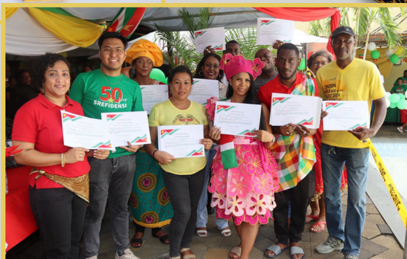
Een impressie van de cook-out