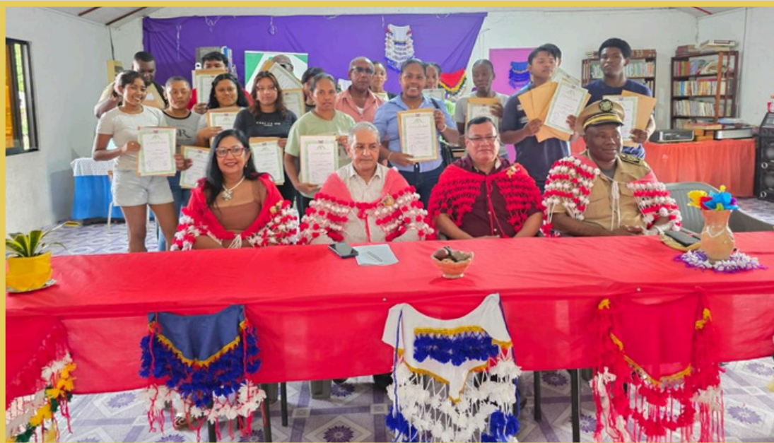
Indrukken van de gelegenheid waarbij het directoraat Welzijn en Arbeid een dependance in gebruik heeft genomen te Wit Santi in het district Para, en waarbij tevens certificaten zijn uitgereikt aan 56 deelnemers uit het district die vaktrainingen van de SAO hebben gevolgd in het kader van het project Wroko Foe Mek Moni.