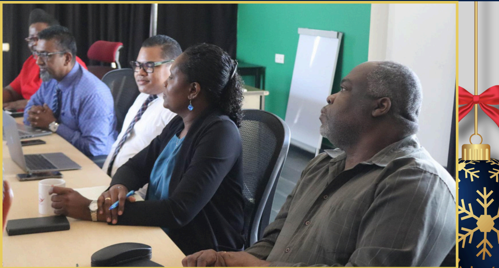
De directie van Welzijn en Arbeid tijdens het gesprek met de IDB-missie

geraakt, waardoor de realisatie van een moderne en toegankelijke Dienst Arbeidsbemiddeling dichterbij komt.