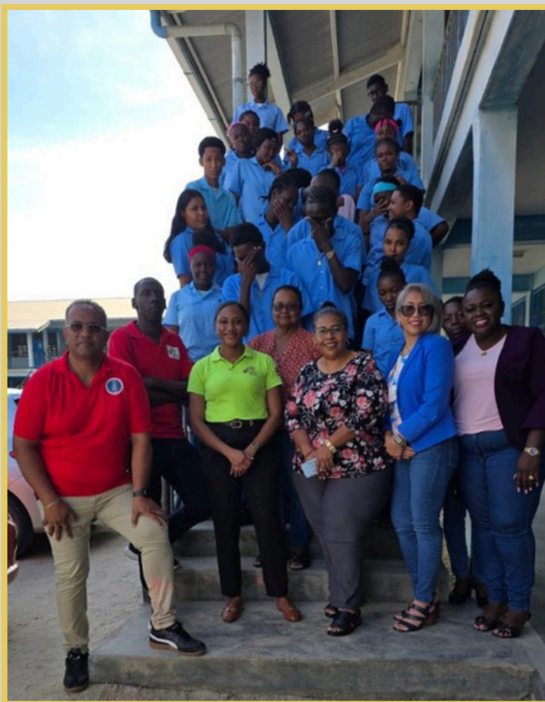
Leden van de Nationale Commissie Uitbanning Kinderarbeid en leerlingen van de O.S. Hockey School ter gelegenheid van de Internationale Dag voor de Rechten van het Kind

Op 20 november wordt wereldwijd de Internationale Dag voor de Rechten van het Kind gevierd. Een belangrijk kinderrecht is de bescherming tegen kinderarbeid. In dat kader organiseerde de Nationale Commissie