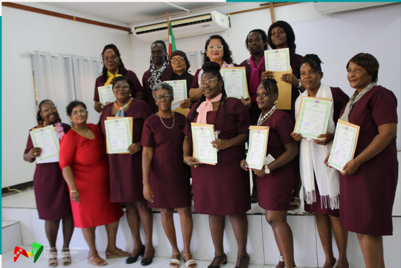
Een deel van de participanten in beeld bij het startsein van het landelijk trainingsproject 'Wroko Foe Mek Moni', in het district Para.