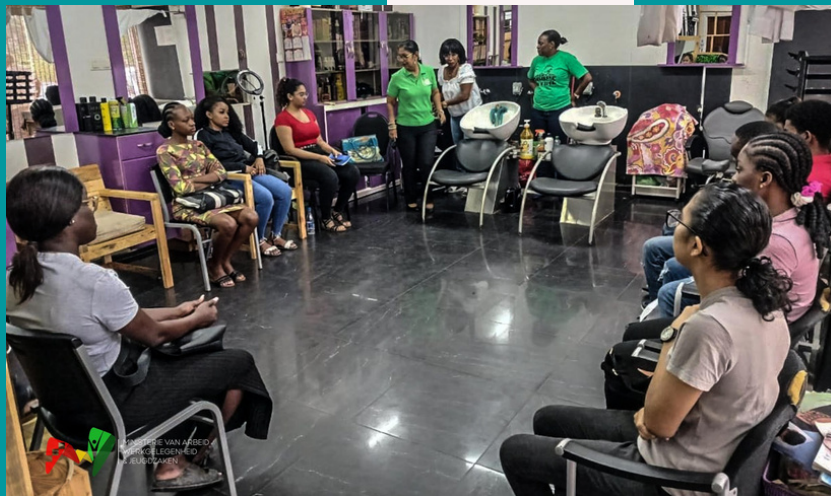
Een moment opname bij het startsein van de Kapper A vaktraining, onderdeel Huid en haar, in de Twins Kapsalon te Paramaribo.