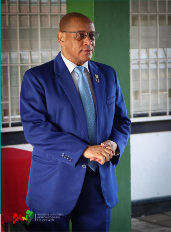
Steven Mac Andrew (Minister AWJ)

Minister Steven Mac Andrew van Arbeid Werkgelegenheid en Jeugdzaken (AWJ) is met succes afgestudeerd aan de Kemmy Business School van de University of Limerick in Ierland in Project and Programme Management. Met blijdschap heeft hij eind december 2023 het bericht van de succesvolle afronding ontvangen van de Kemmy Business School. De bewindsman heeft hiermee de graad van Master of Science in Project en Programme Management behaald. Mac Andrew begon deze studie in 2021 voor het aanvaarden van het ambt van minister en heeft het programma conform de normale studieduur afgewerkt, ondanks de druk van het werk. De officiële graduation ceremony is gesteld op 23 januari 2024, maar de bewindsman zal dit niet bijwonen, vanwege de geplande begrotingsbehandeling in De Nationale Assemblée (DNA).