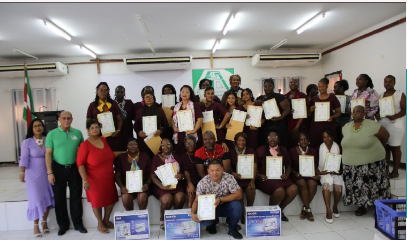
Van linksuit de 2e: minister Steven Mac Andrew te midden van de genodigden en de geslaagde cursisten in Coronie.

Hun enthousiasme was voor hem een duidelijk teken dat Coronie smachtte naar de vaktrainingen, gezien de laatste training in het district dateerde van 2008, dus langer dan 15 jaar geleden. Mac Andrew verduidelijkt dat 'Wroko Foe Mek Moni' landelijk de nodige tijd en moeite vereist van de participanten aan wie trainingen geheel kosteloos wordt aangeboden. De SAO voorziet eveneens in het benodigde lesmateriaal. Hij riep de geslaagden op om als waarachtige SAO Ambassadeurs aan de slag te gaan, de opgedane kennis en kunde verder te ontwikkelen en kwalitatief goede producten op de markt te brengen. Alle 29 vrouwen hebben een naaimachine ontvangen, zodat ze inderdaad volop aan de slag kunnen. Mac Andrew heeft de wens uitgesproken dat wanneer hij wederom een bezoek zal brengen aan Coronie, hij de producten van de geslaagde cursisten zoals kleding, tassen en tafelkleden wil zien.