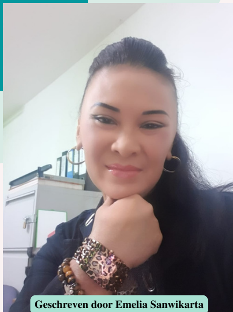
Geschreven door Emelia Sanwikarta