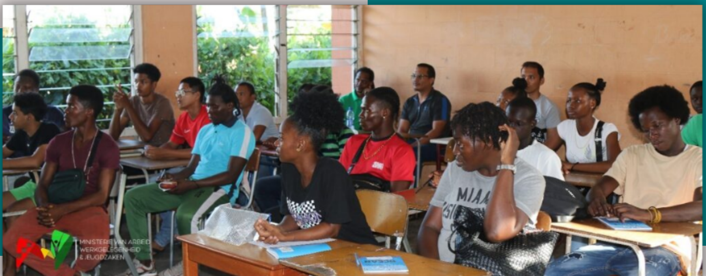
Een deel van de participanten in beeld bij het startsein van het landelijk trainingsproject 'Wroko Foe Mek Moni', in het district Para.

De uitvoer van dit landelijk project is vastgesteld op 18 maanden waarbij onder andere ook de vaktrainingen Autobody repair, Lassen module-1, Automontage, Textiele werkvormen, Verpleegassistent, Webdevelopment, Micro shading, Kapperstraining-A, Manicure en Pedicure zullen worden aangeboden.