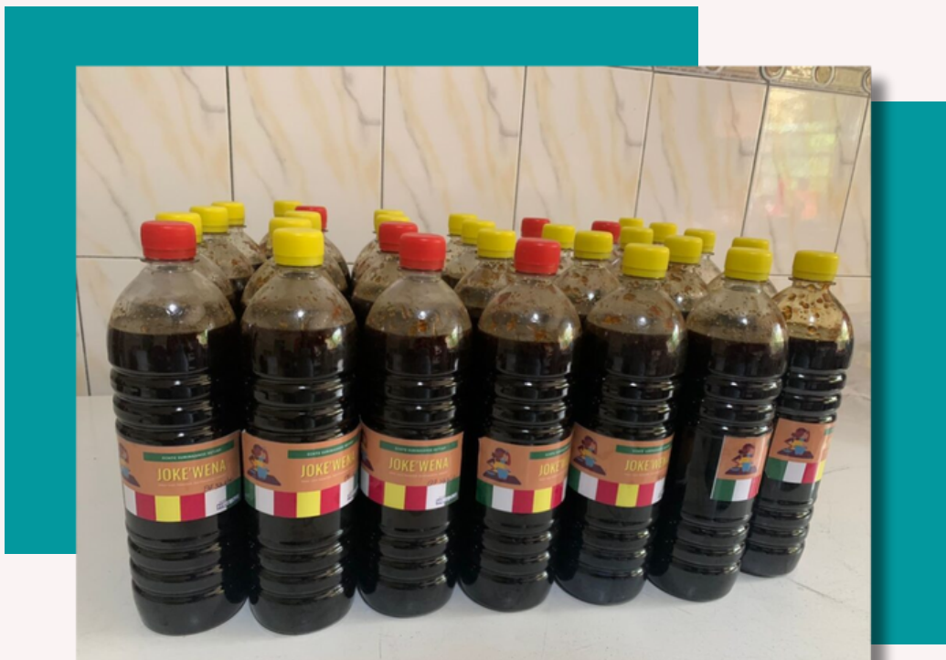
Ketjap productie: producten van een micro- ondernemer met een beperking.

De doelgroep heeft eerder ondersteuning gehad van de UNDP en geprofiteerd van een project onder het Basic Needs Trust Fund-9 programma (BNTF-9) van de Caribbean Development Bank (CDB). Het UNDP- project is in december 2023 van start gegaan en biedt nu de mogelijkheid om het voorgaande te realiseren middels dataverzameling gebruikmakend van veldbezoeken, het verstrekken van incentives en begeleiding in de financiële administratie. Personen met een beperking hebben training en middelen gehad om een micro- onderneming te starten. Het betreft een groep van 30 personen. Van de dertig (30) mensen met een beperking- afkomstig van het 1e project van de UNDP- die ook hebben geparticipeerd in het BNTF-9 traject, zijn er totaal 18 mensen in aanmerking gekomen voor incentives zoals machines, materialen en grondstoffen. Daarnaast hebben alle 30 micro-ondernemers met een beperking een cursus gevolgd in basis ondernemerschap. In dit programma is het onderdeel coaching eveneens afgehandeld, om de micro-ondernemers verder te begeleiden.