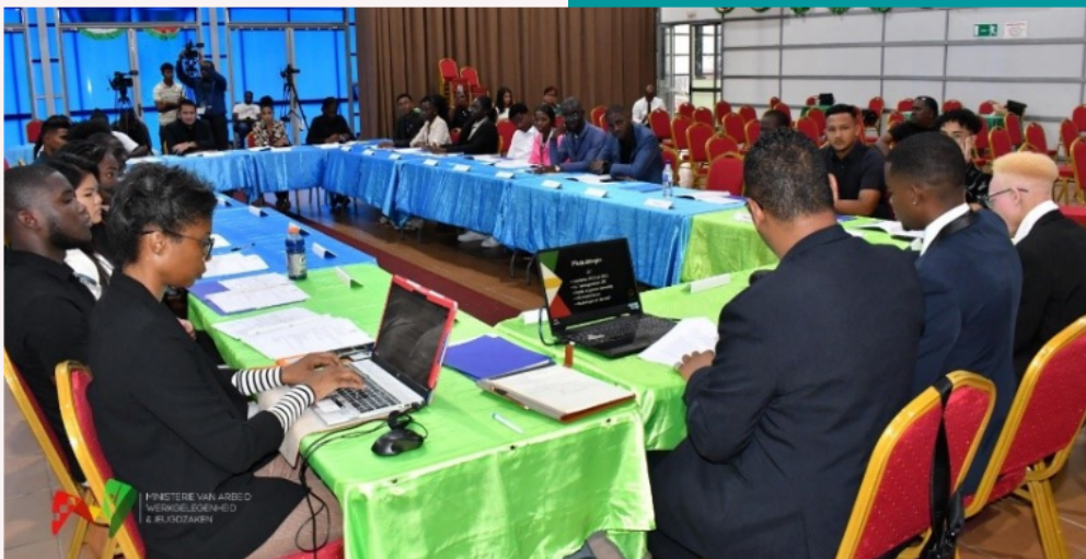
Een momentopname tijdens de eerste openbare vergadering van de Jeugdraad Suriname