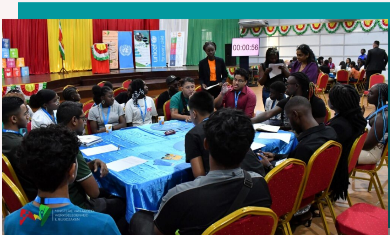
Een momentopname tijdens het Nationaal Jeugdcongres 2023 waarbij jongeren van gedachten hebben gewisseld over verschillende maatschappelijke onderwerpen.