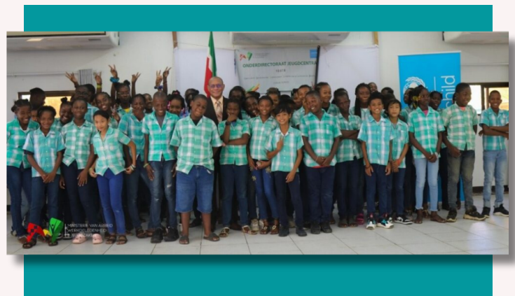
Minister Steven Mac Andrew van AWJ omringt door kinderen van Coronie die hebben deelgenomen aan het project 'Kinderrechten'

De uitvoering van het project 'Kinderrechten' van het ministerie van AWJ geschiedt in samenwerking met UNICEF en richt zich op de bewustwording van de naleving van het verdrag van de Universele Verklaring van de Rechten van het Kind, ook wel het Kinderrechtenverdrag genoemd. Suriname heeft dit verdrag ondertekend en is daarom verplicht erop toe te zien dat de rechten van kinderen worden nageleefd en beschermd. Middels dit project vraagt het ministerie in verschillende districten aandacht voor kinderrechten van het Surinaams kind. Dit project wordt getrokken door het onderdirectoraat Jeugdcentra van het ministerie.