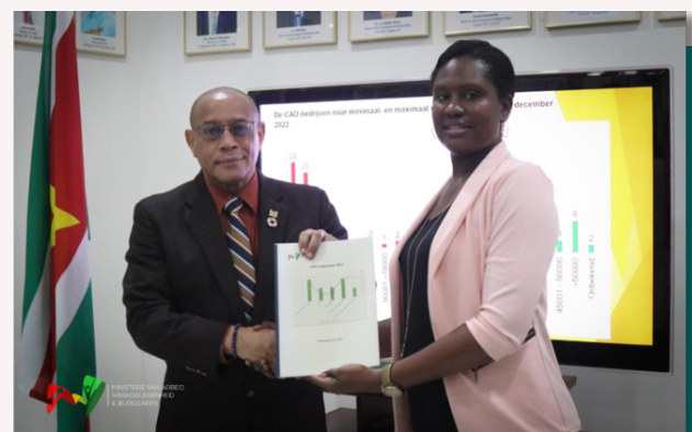
Minister Steven Mac Andrew neemt het onderzoeksrapport "CAO-onderzoek 2022" in ontvangst

Het verzamelen van de gegevens is over het algemeen goed verlopen. Het responspercentage is iets meer dan 80 procent. De resultaten van dit onderzoek kunnen nuttig worden gebruikt door beleidsmakers, werkgevers en vakbonden, bij het maken van beleid over arbeidsverhoudingen of bij de ontwikkeling van nieuwe collectieve arbeidsovereenkomsten. De onderzoeksresultaten zijn op woensdag 2 augustus 2023 gepresenteerd aan de minister en staf van het ministerie. Minister Steven Mac Andrew benadrukte tijdens de presentatie dat werkgevers verplicht zijn om cao's te registreren, omdat slechts door registratie, cao's rechtsgeldigheid krijgen.