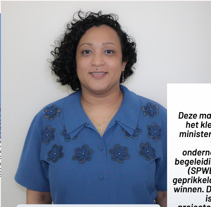
Geschreven door: Simone Haridat