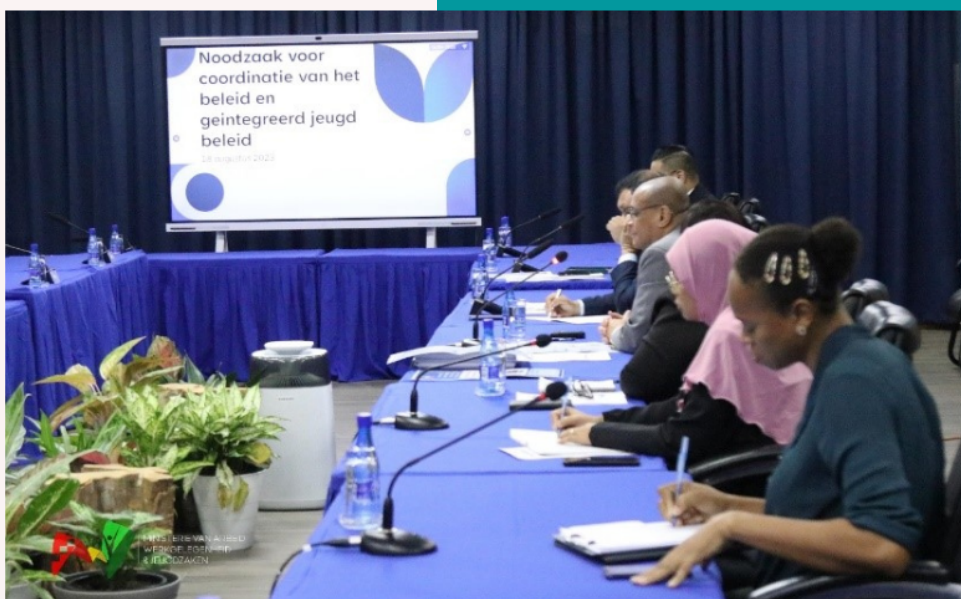
Een impressie van de coördinatie-meeting met verschillende ministers en vertegenwoordigers van ministeries over een geïntegreerde aanpak van het jeugdbeleid en de jeugdproblematiek.

Na de presentatie gingen de ministers en overige participanten in op het gepresenteerde concept van Youth POWER en Jeugdprofiel, het beleid en ontwikkelingen op hun respectievelijke ministeries, maar ook uitdagingen waarmee zij geconfronteerd worden. Hierbij kwamen key issues, zoals het ernstig verval van normen en waarden, maar ook de negatieve sociale impact van de economische situatie van het land op jongeren aan de orde. De ministers en overige participanten waren het allemaal eens over de noodzaak van een geïntegreerde aanpak van het jeugdbeleid. Er komt op kort termijn een follow-up meeting ter verdere bespreking van aangedragen oplossingen, maar ook om het jeugdbeleid verder te stroomlijnen.