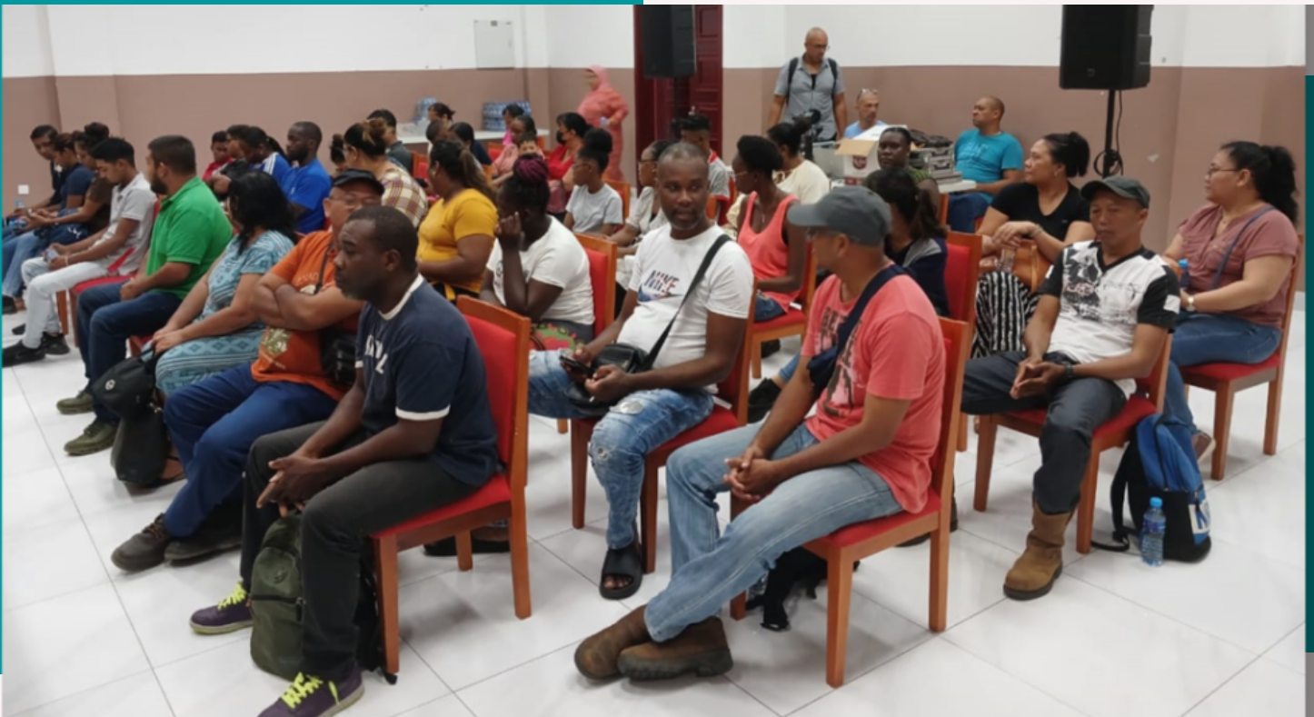
Een deel van de cursisten in de zaal.