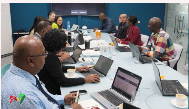
De bespreking tussen het ministerie van AWJ en de IDB over het project uitvoeringsplan in het kader van het project "Labor Market Alignment with New Industries".

Na een hele tijd van voorbereiding wordt het project 'Labor Market Alignment With New Industries' (Afstemming van de arbeidsmarkt op nieuwe sectoren) op donderdag 10 augustus 2023 gelanceerd. Met dit project beoogt het ministerie van AWJ, met financiële ondersteuning van de Inter-American Development Bank (IDB), om werkzoekenden vaardigheden aan te leren die zijn afgestemd op de behoeften van de productieve sector. Ook moet dit project resulteren in het vergroten van de toegang van werkzoekenden tot arbeidsmarkt bemiddelingsdiensten door arbeidsmarkt informatie over werk en werving toegankelijk te maken voor hen. Dit project is een van de projecten in ons land waarachter de IDB staat ter ondersteuning van Suriname bij het voortbouwen op zijn sterke punten om duurzame groei en ontwikkeling te bereiken. Vooruitlopend op de officiële lancering van het project, heeft er op maandag 7 augustus 2023, een onderhoud plaatsgevonden tussen minister Steven Mac Andrew en de IDB over het project uitvoeringsplan oftewel de uit te voeren strategie om het project succesvol te implementeren. Bij deze gelegenheid waren ook aanwezig de medewerkers van de Program Implementation Unit (PIU) en de onderdirecteur Arbeidsmarkt, Naomi Esajas-Frierson.