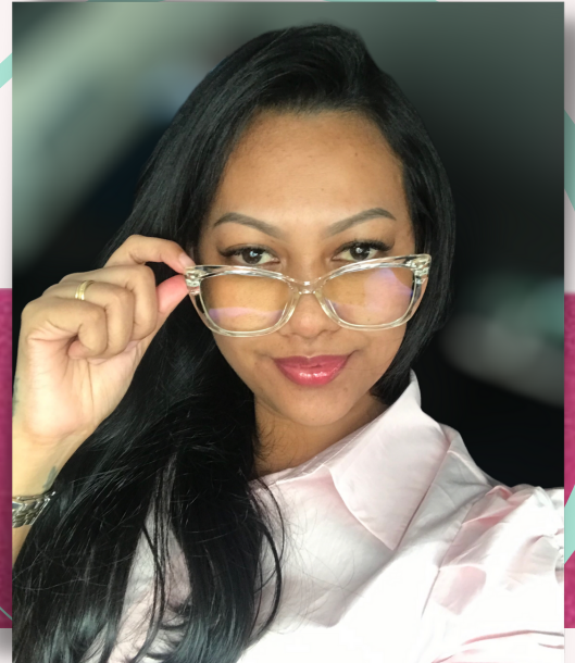
Geschreven door: Lucretia Setrodipo

De schrijver van deze rubriek is Lucretia Setrodipo, communicatiewerker op het ministerie met een speciaal nieuwsgierig oog voor kwaliteiten van collega's op het ministerie.