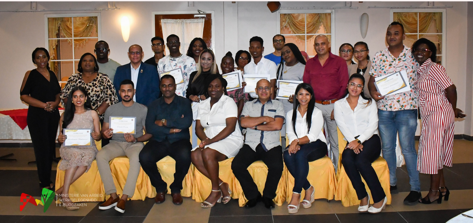
Ex-leden van het Nationaal Jeugd Parlement, minister AWJ, directie Jeugdzaken en Nationaal Jeugd Instituut en de leden van de Verkiezingscommissie Jeugdraad Suriname

De nieuwe leden van de jeugdraad zullen volgens hem continu worden begeleid, zodat ze hun werk als jeugdvertegenwoordiger goed kunnen uitvoeren, waardoor het vertrouwen van jongeren in jeugd participatie terug gewonnen kan worden. De minister benadrukte, dat de gang naar de JRS dus niet slechts een kwestie van rebranding is, maar een andere wijze is van het bevorderen van jongeren participatie. De minister gaf ook aan, dat Suriname door het houden van verkiezingen voor jeugdvertegenwoordigers altijd een best practice was in het Caribisch gebied en dat deze traditie normaal voortgezet zal worden in de toekomst.