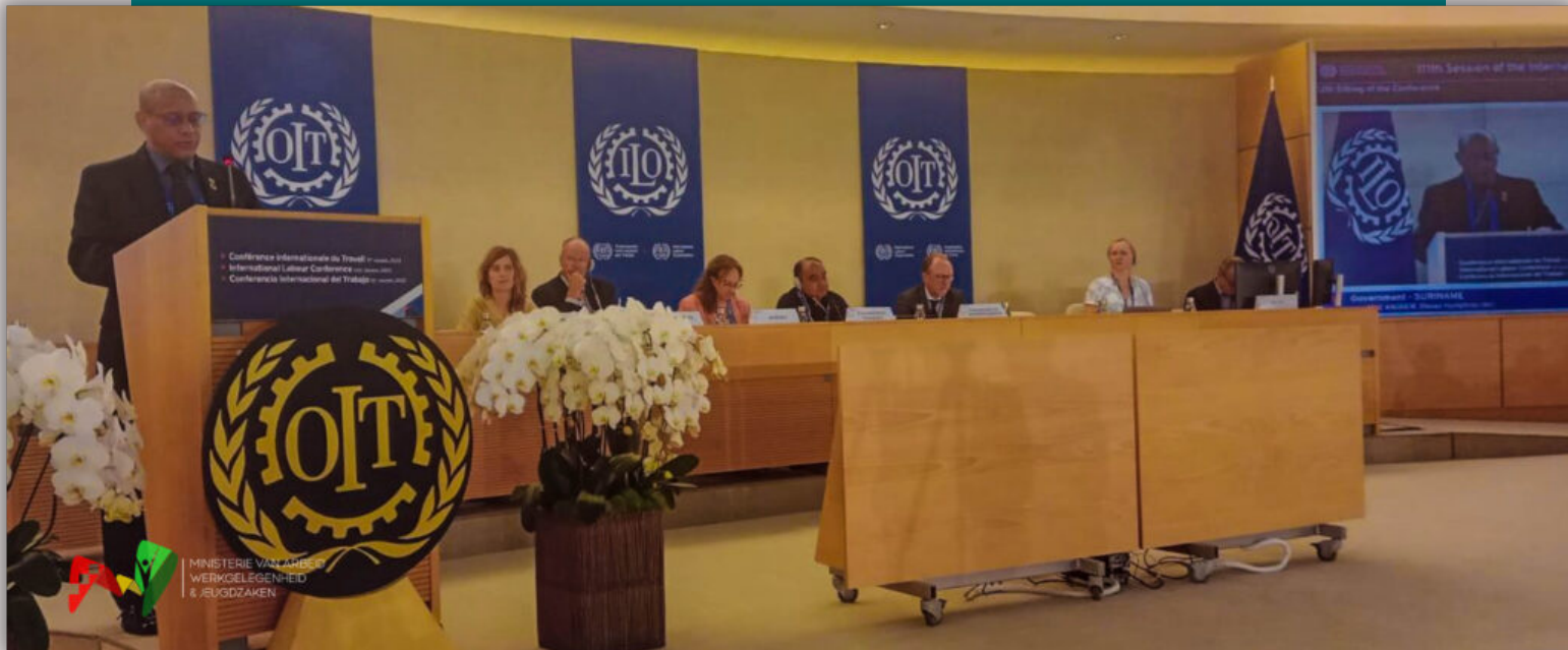
Minister Steven Mac Andrew van Arbeid Werkgelegenheid & Jeugdzaken spreekt de 111de Internationale Arbeidsconferentie in Genève, Zwitserland, toe op dinsdag 13 juni 2023.

Minister Steven Mac Andrew van Arbeid Werkgelegenheid & Jeugdzaken, heeft het belang van sociale rechtvaardigheid en Decent Work benadrukt op de 111de Internationale Arbeidsconferentie (ILC) in Genève, Zwitserland. Deze conferentie van de Internationale Arbeidsorganisatie is op 5 juni begonnen en duurt tot 16 juni 2023. De ILC kan worden beschouwd als het wereldparlement van de Arbeid. Suriname is ook aanwezig op deze conferentie met een kleine delegatie onder leiding van minister Mac Andrew. Op dinsdag 13 juni 2023 mocht de bewindsman de conferentie namens Suriname toespreken.