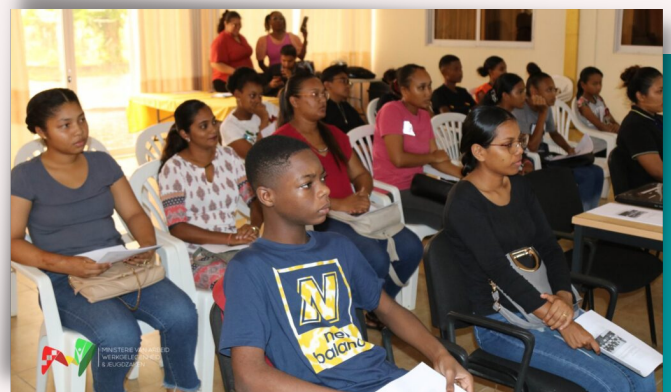
Een deel van de jongeren van Saramacca dat participeert in de training Computervaardigheden, aangeboden door het Ministerie van AWJ.