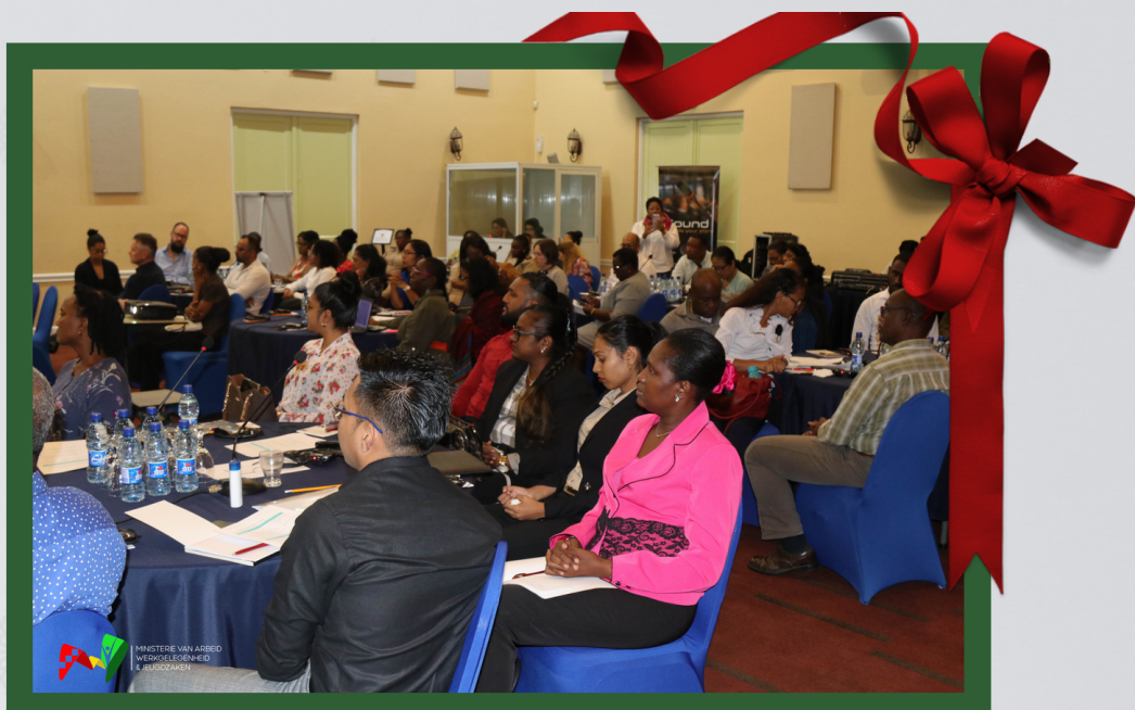
Een moment opname tijdens de validatie workshop in Royal Torarica.