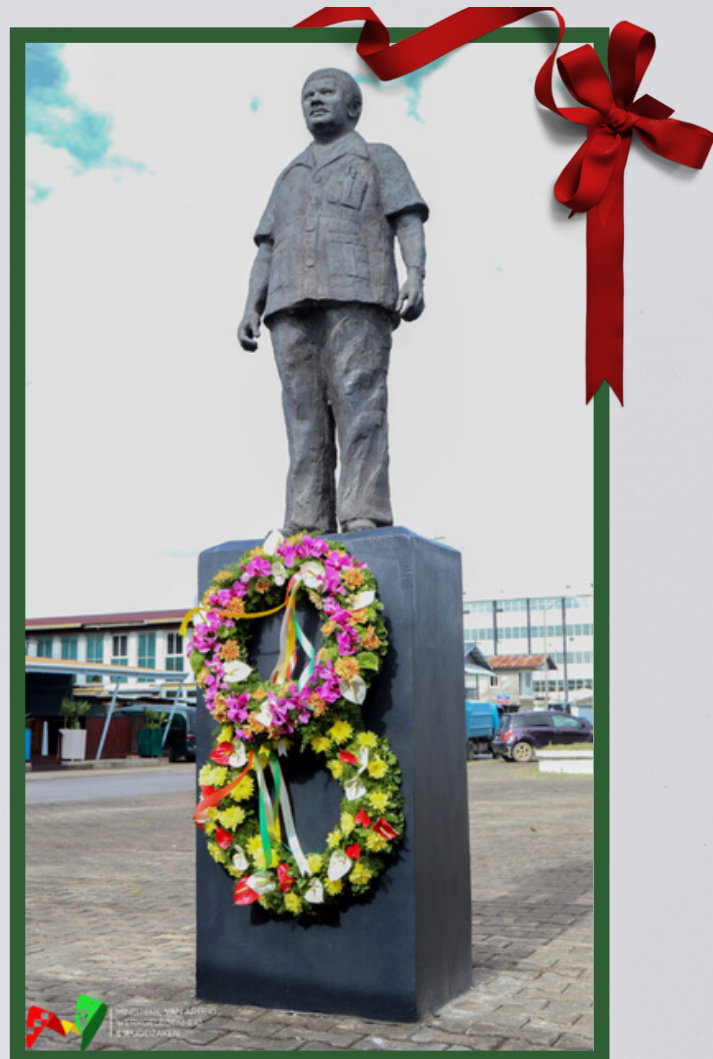
Standbeeld Cyrill Daal op het Pater Weidmanplein aan de Dr. Sophie Redmondstraat.