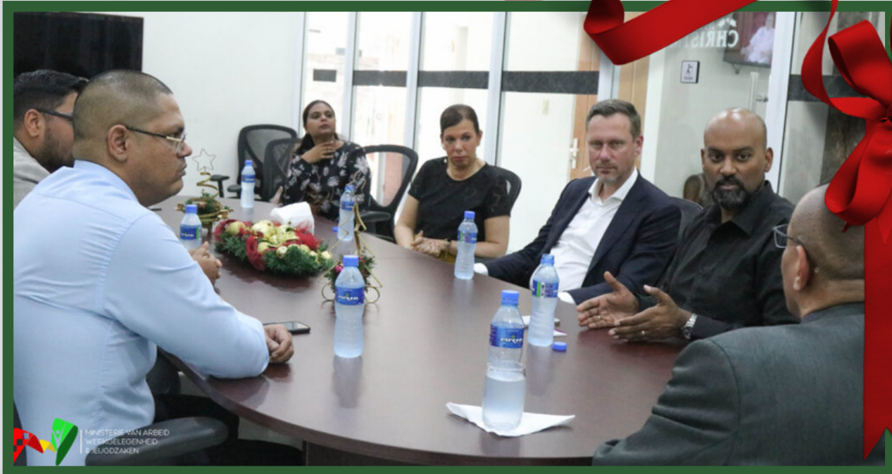
Minister Mac Andrew in gesprek met een vertegenwoordiging van Teleperformance en Suriname Investment and Trade Agency (SITA).

Het opendeurbeleid van minister Steven Mac Andrew draagt bij dat steeds meer personen, maatschappelijke organisaties en bedrijven zich aanmelden bij het ministerie om hun bijdrage te leveren aan of hun visie te geven op het beleid dat uitgevoerd wordt of moet worden. Zo ontving de bewindsman op woensdag 30 november 2022 een vertegenwoordiging van het bedrijf Teleperformance voor een courtesy call. Een vertegenwoordiging van de Suriname Investment and Trade Agency (SITA) was bij dit onderhoud ook aanwezig.