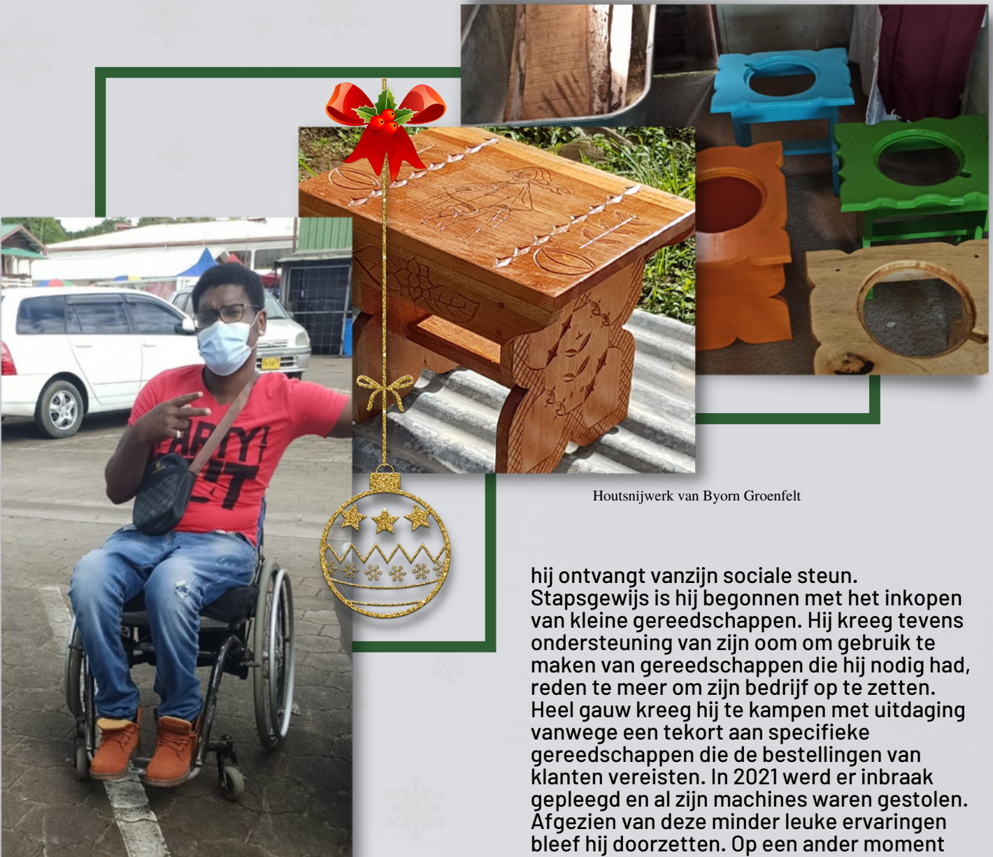
Houtsnijwerk van Byorn Groenfelt