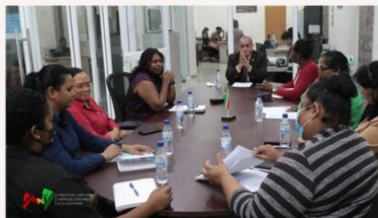
Minister Steven Mac Andrew in gesprek met leden van de commissie Armoedegrensbeplanning.

Zowel minister Mac Andrew als de commissie benadrukte tijdens het onderhoud de noodzaak voor een landelijke armoedesurvey alsook een permanente commissie Armoede, welke op geïntegreerde wijze het vraagstuk zal moeten blijven bestuderen om de regering omstandig te kunnen adviseren over mogelijk armoedebestrijdings en -verminderingbeleid. De minister benadrukte vol verwachting te zullen uitkijken naar het finaal rapport met beleidsaanbevelingen. De commissie is in juli 2021 geïnstalleerd.