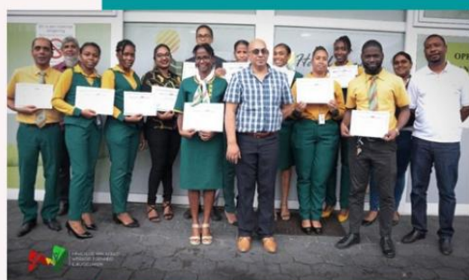
Een klantvriendelijke smile te zien op de gezichten van de medewerkers van APF die hun certificaat van SWPE met veel trots tonen aan de fotograaf.

Afgezien van het feit dat de Stichting Productieve Werk Eenheden (SPWE), ondernemerschap stimuleert onder de beroepsbevolking, tracht zij ook de employability te stimuleren van werknemers binnen bedrijven met de bedoeling dat ze bij de tijd blijven en beter inzetbaar zijn.