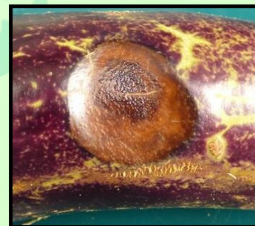
Kleine zwarte structuren op de vlek