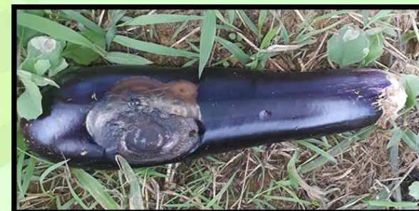
Vruchtrot bij boulangier